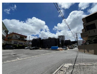
2階以上 駐車場あり