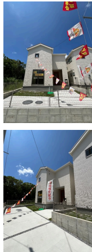
2階以上 駐車場あり