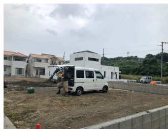
2階以上 駐車場あり 駐車場2台以上