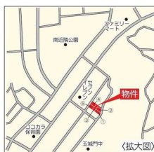
カーナビは糸満市真栄里1402