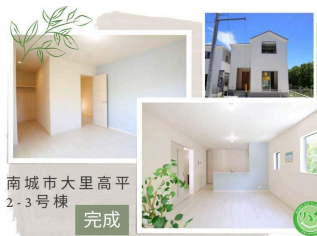
南城市大里高平 2-3号棟