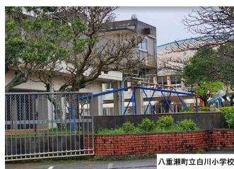
八重瀬町立白川小学校