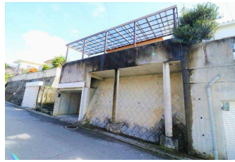
庭付き 駐車場あり