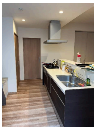
駐車場あり 駐車場2台以上