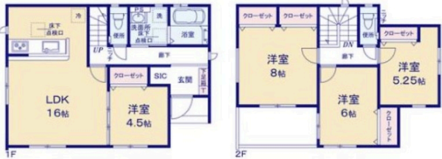
※SIC シューズインクローゼット