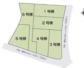
※図面と現況の相違は現況を優先します。