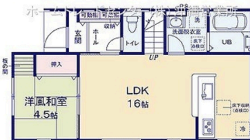
※WIC:ウォークインクローゼット