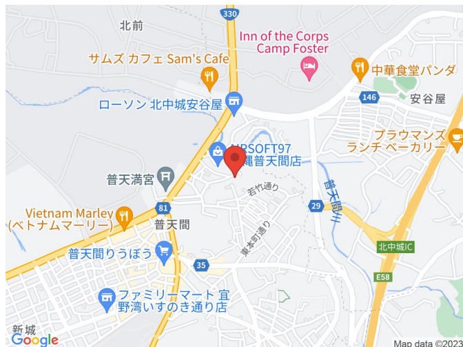
【ラフィナーズベル普天間】

2階以上 角部屋 フローリング 内装リフォーム ペット可 海が見える 駐車場あり 1階全面駐車場