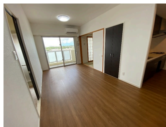
和室あり 即入居可 駐車場あり