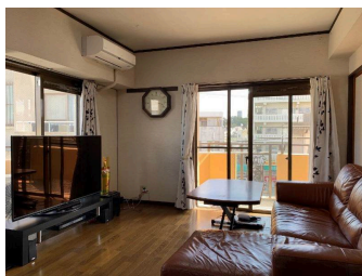
2階以上 角部屋 和室あり