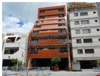
2階以上 駐車場あり