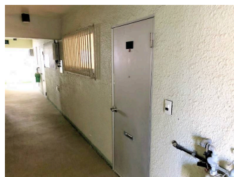
2階以上 内装リフォーム