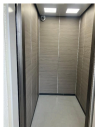
2階以上 最上階 駐車場あり