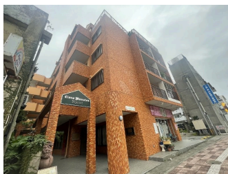
2階以上 角部屋 フローリング